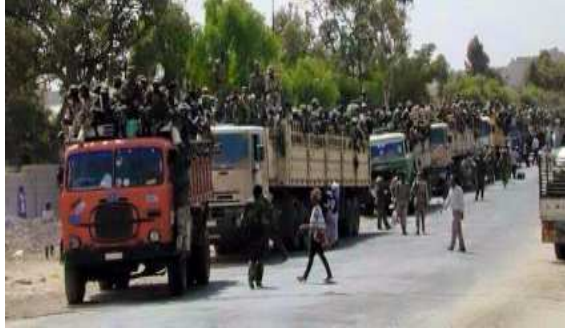
ንህዝቢ ን25 ዓመት ዝደሃኸ

መንእሰይ ከንዲ ብኣውቶቡስ ብኸብረት ከም እኸሊ ዕንጨይቲ ብመካይን ጽዕነት ከጓረት ብጭፍራ ህግደፍ ሰኢሉ ክብረት ትም ውጽኢቱ ምልኪ ን25 ዓመት ባርነት..