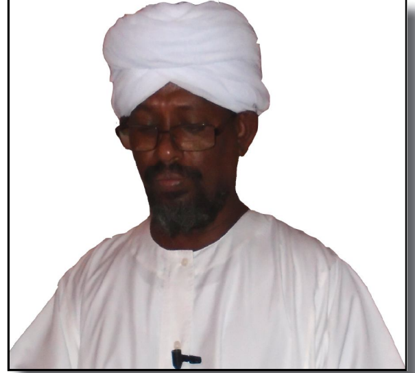
الشيخ منصور طه

عرفتها وصورتها في ميثاقها على مفهوم اقصائي طائفي . والانطلاق منهما في شرعية معنوية وسياسية . ورسمها كأساس لكل المفاهيم والسياسات التي تنطلق منها . وهكذا تأسس مشروعها الاستثنائي الإقصائي الذي ظهر بلافتات مختلفة ومرجعية واحدة خدعت الكثيرين . ولكن التطبيقات كانت واضحة المؤشر والاتجاه بدءا بمرحلة الكفاح وانتهاء بالدولة . هذا المشروع أضر كثيرا بالوطن وخرب قيم ومكتسبات الشعب السياسية والثقافية وبنيتة الاجتماعية .